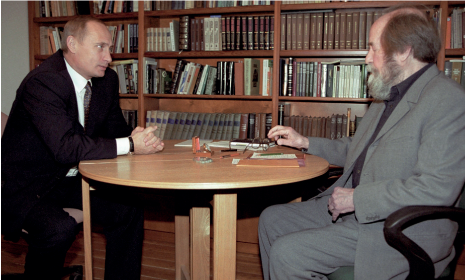
Президент РФ Владимир Путин и Александр Солженицын во время беседы в библиотеке писателя. 20.09.2000

ляет сомнений в истоках современной российской политической философии.