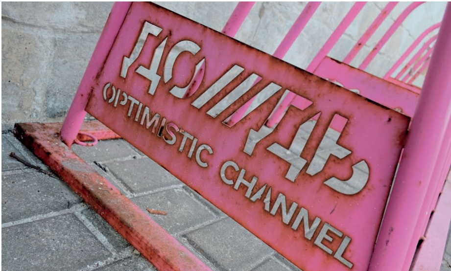
Велопарковка с символикой телекомпании «Дождь» в Москве

В результате оппозиционные СМИ лишь стимулировали политически неосмысленную протестную активность. Неспособные ни понять, ни разглядеть альтернативу, они, естественно, были не в состоянии ее поддержать. Не разъясняя, кто и как может изменить Систему и ситуацию в стране, такая пресса подталкивала одних к бессмысленному бунту, других — к глубокой апатии.