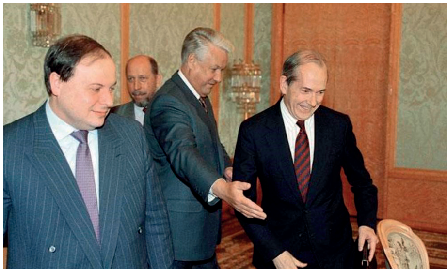
Президент России Борис Ельцин, премьер-министр России Егор Гайдар и глава Международного валютного фонда Мишель Камdessus в Кремле. Россия, июль 1992 года

провозглашены «финансовая стабилизация», либерализация и приватизация в обмен на кредиты МВФ. 2 января 1992 года под руководством президента и председателя российского правительства Бориса Ельцина и его заместителя Егора Гайдара была осуществлена попытка начать финансовую стабилизацию путем так называемой либерализации цен: по сути, в стране, где не было ни одного частного предприятия и в принципе отсутствовала конкуренция, был снят контроль за ценами. В действительности была осуществлена либерализация советских государственных монополий, которая привела к гиперинфляции в 2600% (в годовом выражении) и, как следствие, к фактической конфискации всех сбережений российских граждан [2].