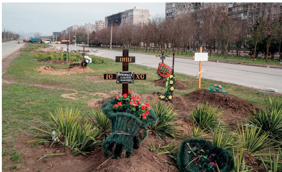
Свежие могилы на одной из улиц Мариуполя во время российской «спецоперации» в Украине. 10.04.2022

Мы, однако, продолжаем существовать в том же общественном пространстве, с теми же моделями поведения и реакций, в том же постмодерне, который был и накануне войны и который довел до нее. Поэтому не стоит относиться к «спецоперации» как к политическому