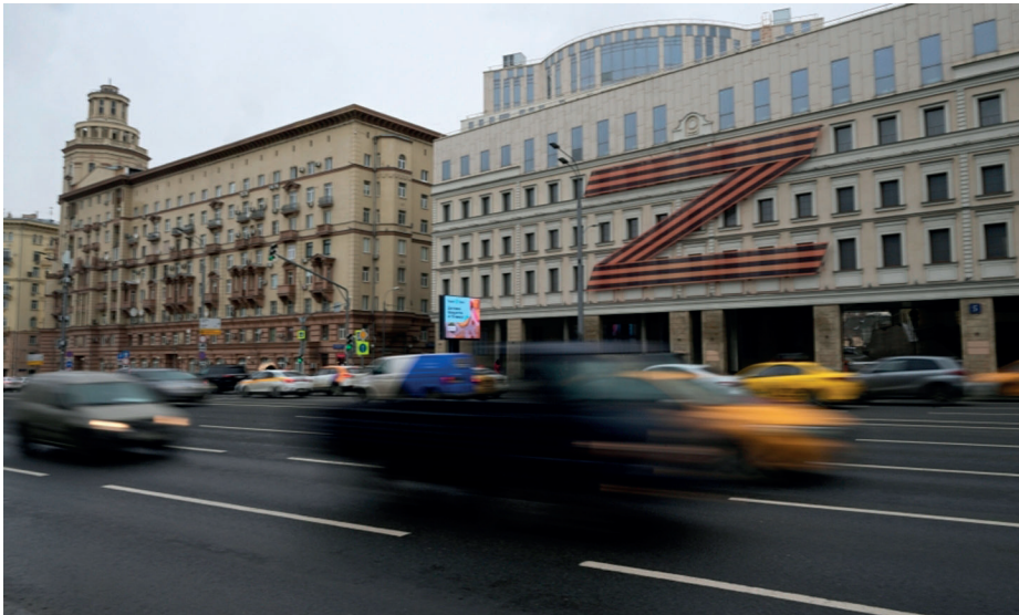
Знак Z в поддержку военной «спецоперации» в Украине на фасаде Театра Олега Табакова в Москве. 29.03.2022

исходит сейчас. Людей убеждают в том, что российское государство (да и любое «сильное и дееспособное» государство) другим вообще быть не может, что единственная альтернатива — хаос («хотите как в Казахстане?» [12]). Политическая энтропия, утрата государственными институтами дееспособности, сбои и «зависание» демократических механизмов действительно являются ключевыми проблемами современности. Поэтому неосталинизм возникает не на пустом месте и в современных обстоятельствах выглядит вовсе не реликтом прошлого, неуместным в мире высоких технологий, социальных сетей и общества потребления. Современный антураж неосталинизму совсем не мешает, напротив — служит удобной оберткой для оправдания.