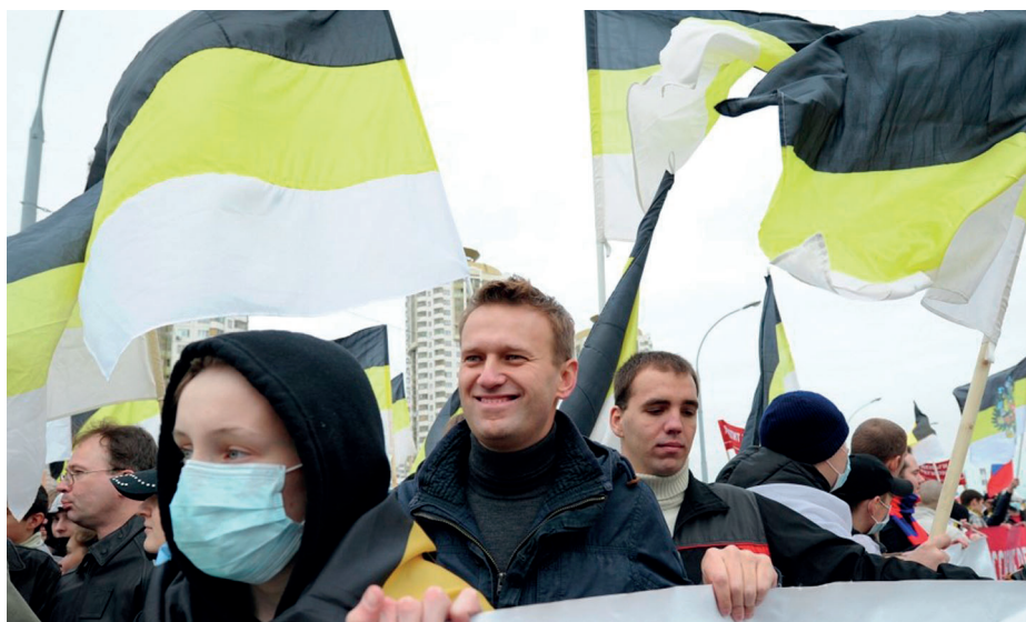
Алексей Навальный на акции «Русского марша» в Москве. 04.11.2011