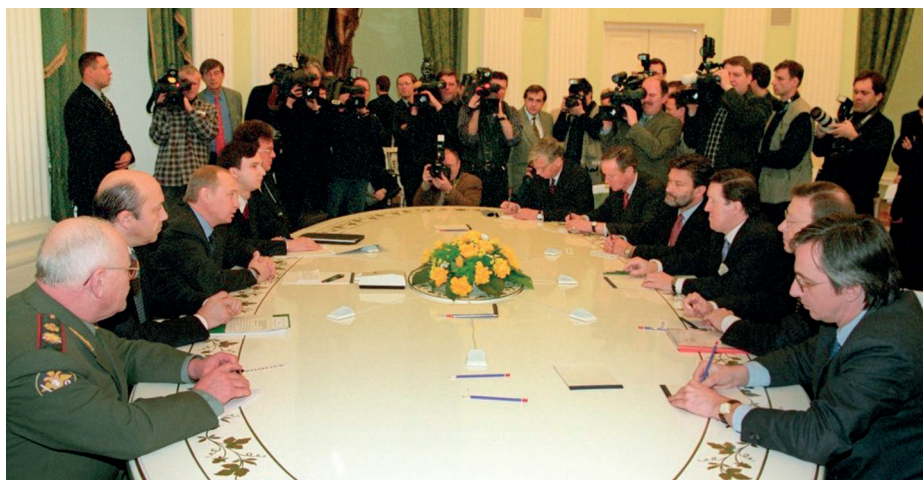
Президент РФ Владимир Путин и генсек НАТО Джордж Робертсон во время переговоров в Кремле. 20.02.2001