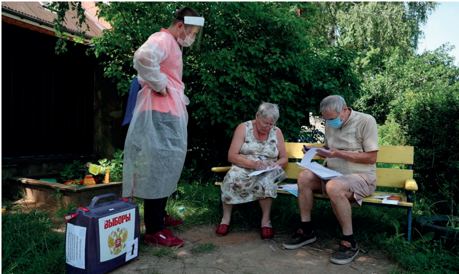
Голосование о поправках к Конституции РФ в деревне Троицкое, Московская область. 25.06.2020

1 июля 2020 года российская олигархическая Система, созданная в ходе реформ 1990-х, перешла на качественно новый этап своего развития: произошло не просто закрепление в Конституции страны несменяемости персональной власти Путина — произошел официальный отказ от формальной ориентации на демократическую легитимность, федерализма, движения вперед от советского прошлого к современной цивилизации XXI века [8]. Это означало окончательный провал постсоветской модернизации. Демократия потерпела поражение.