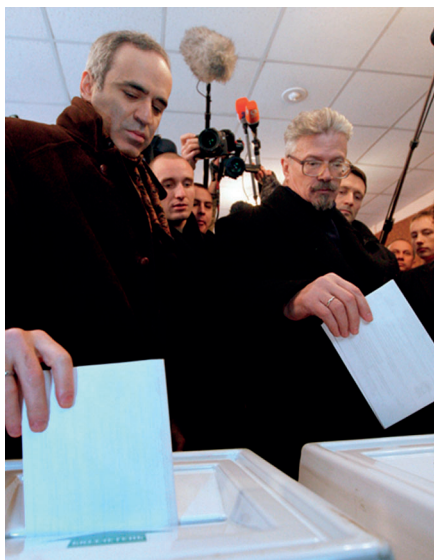
Гарри Каспаров и Эдуард Лимонов голосуют на выборах депутатов Государственной Думы РФ. 2.12.2007

(движение «наХ-наХ» 37 ) или голосовать «за кого угодно, кроме ЕР» 38 , а в 2021-м агитировали с помощью «умного голосования» выбирать верных сателлитов Путина — коммунистов, жириновцев, справедливороссов-прилепинцев, каких-то якобы «новых людей» [21]; бесплодно и популистски пытались подменить активизмом серьезную политику [22] и сделать протест «неполитическим» — с белыми ленточками и «Оккупай Абай» («Нам политики не нужны» — популярный слоган на протестных гуляниях с белыми шариками по московским бульварам в 2012–2013 годах и отказ от поддержки демократического кандидата в президенты в 2012 и 2018 годах). И главная ответственность наиболее активной группы постсоветской