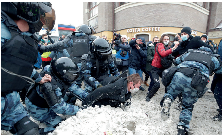
Сотрудники Росгвардии проводят задержания на протестных акциях в Москве. 31.01.2021