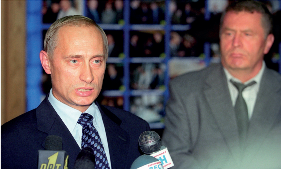
Встреча и.о. президента РФ Владимира Путина с членами фракции ЛДПР во главе с Владимиром Жириновским. 12.08.1999

частной собственностью, а главное, соблюдением прав человека и свободами.