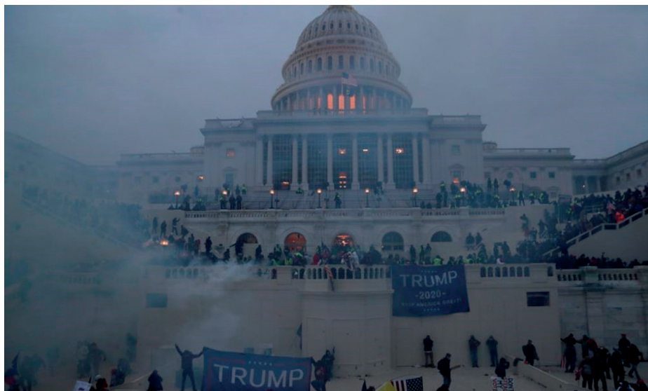
Здание Капитолия в Вашингтоне. 06.01.2021

В целом в политике Запада последние три десятилетия отсутствовали понимание и политическая стратегия будущего, к которому человечество могло бы стремиться. Да и текущей политикой западные элиты занимаются из рук вон плохо, примеров достаточно: бегство США из Афганистана прошлым летом, опасное и нарастающее враждебное противостояние между республиканцами и демократами, обещающее отнюдь не обычные предвыборные столкновения в американском обществе, британский «брекзит» и конфликты с правящими Польшей и Венгрией в Евросоюзе [24]. Конечно, экономико-политическая модель ЕС является для России (как и для Украины) абсолютным стратегическим ориентиром. Однако, учитывая невысокое качество современной практической политики Запада и, как следствие, его собственные проблемы, нам в нынешней ситуации следует ориентироваться только на себя и прежде всего самим искать выход из катастрофы.