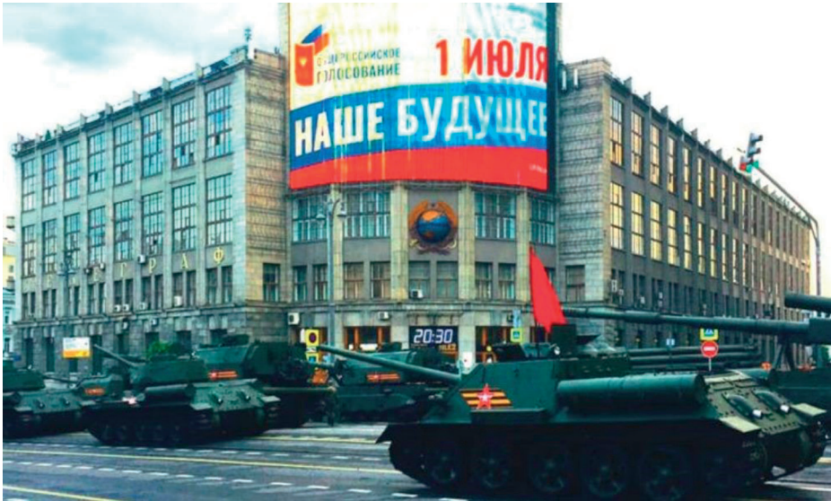
Репетиция Парада Победы в Москве на фоне агитации за голосование по поправкам к Конституции. Июнь 2020

СССР и потеря перспективы, а вместе с ней утрата понимания смысла жизни. Формула кардинального отстранения от политики «вы не лезете в политику, а мы вас кормим и защищаем» дала вот такой результат: национальной идеей вместо построения европейского будущего стало противостояние с Западом, новый миропорядок, мессианская роль России и Путина. Потому что люди, лишенные прав и свобод, возможности полноценного участия в политике, самореализации и самоуважения, с готовностью принимают тоталитарную идеологию. Причем эта идеология не только становится инструментом управления населением, но и в какой-то момент оказывается внутренним стержнем для граждан. И поскольку абсолютное большинство людей в России, по сути, уже давно изолированы от реальной политики, власть легко заменила возможности, которые предоставлены людям в современном свободном мире, на идеи, выпадающие из времени, соответствующие позапрошлому или прошлому веку. Тем более что авторитарной власти не нужны творческие и свободные люди, которые захотят эту власть сменить. Опорой режима стали зависимые, лояльные, подневольные граждане.