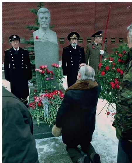
На могиле Иосифа Сталина. Москва, Кремль, 2010-е годы

произошло, это сформировало отношение к советско-большевистскому наследию как к закономерному этапу российской истории, достойному преемственности. Реалии посткоммунистической России резко разошлись с представлениями о них в конце 1980-х — начале 1990-х годов, когда мечтали о реформах и новой современной стране.