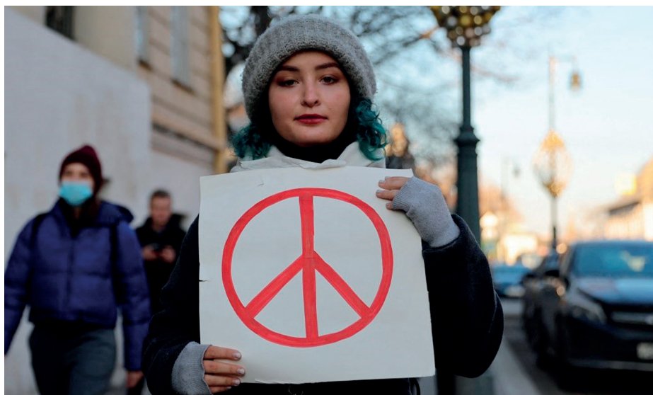
Девушка в одиночном пикете в центре Москвы протестует против военной «спецоперации» в Украине. 27.02.2022