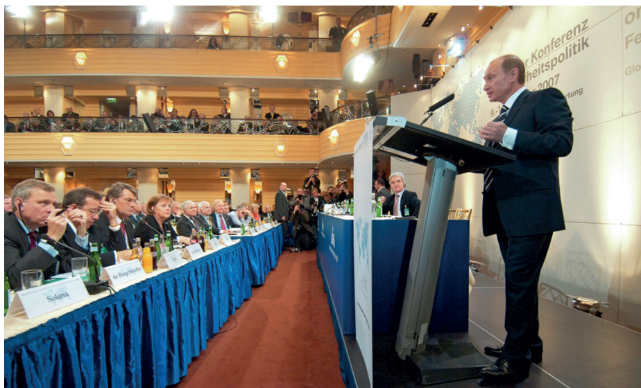
Президент России Владимир Путин во время выступления на 43-й Мюнхенской конференции по безопасности. 11.02.2007

В отсутствие стратегии, опирающейся, с одной стороны, на реалии XXI века, а с другой — на историю и культуру России как органическую часть европейской цивилизации, искусственно был создан постмодернистский тренд, направленный в прошлое, к ресентименту, реваншу, восстановлению некоего «былого величия». В 2007 году на фоне заоблачных цен на нефть Путин объявил о новой холодной войне, цель которой — поделить мир на сферы влияния между Россией, Китаем и США 30 . Это был «осознанный выбор» российского режима [16]. Разрыв постсоветского пространства, события 2013–2014 годов в Украине, аннексия Крыма и кровопролитие в Донбассе стали прямыми следствиями этого выбора [17].