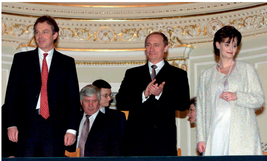
Премьер-министр Великобритании Тони Блэр и кандидат в президенты России Владимир Путин в Мариинском театре на опере «Война и мир». 11.03.2000