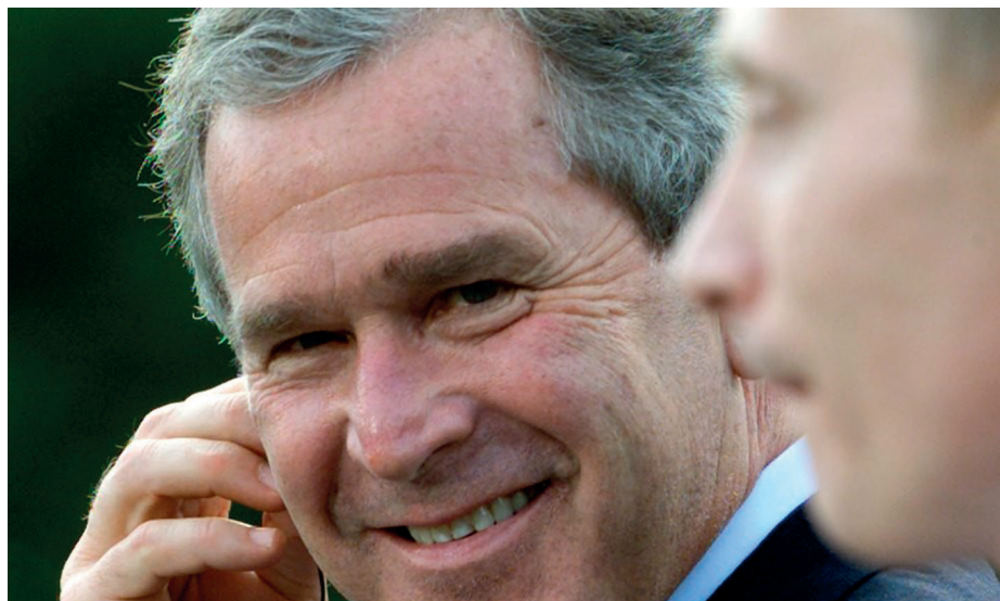
Президент США Джордж Буш-младший смотрит в глаза президенту России Владимиру Путину. Любляна. 16.06.2001