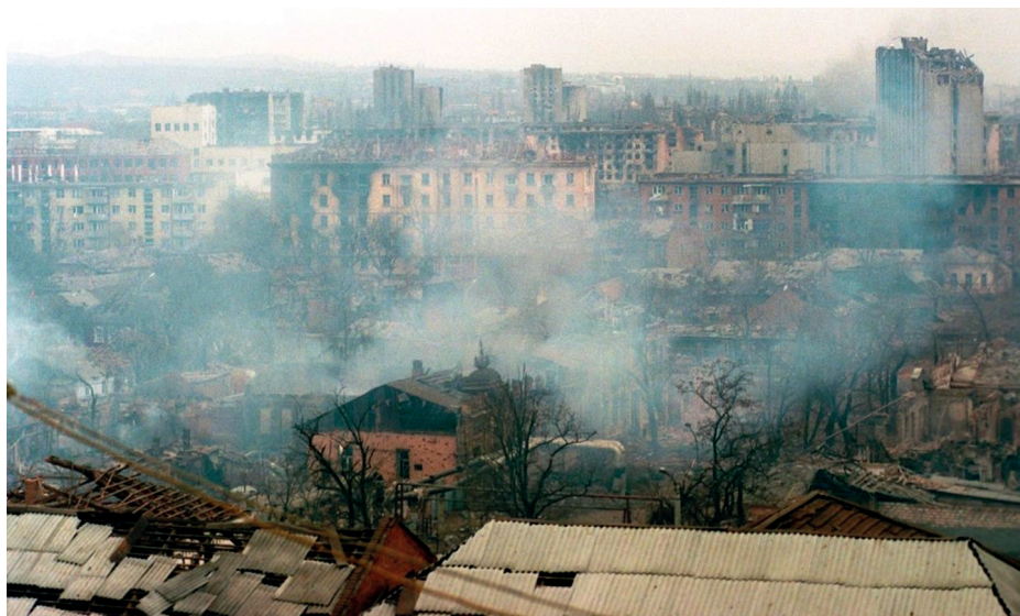
Грозный во время Первой чеченской войны. 20.01.1995

Что касается попыток Запада оказать беспрецедентное давление на Россию, исторический опыт ясно указывает на то, что санкции крайне редко способствуют прекращению военных авантур. В течение XX века только три из 19 попыток использовать санкции в качестве политического инструмента для предотвращения войны оказались успешными 62 . Современные реалии таковы, что, как только всем станет очевиден постоянный характер санкционных мер, этот инструмент утратит всякую эффективность в вопросе достижения мира. И одна из ключевых причин этого заключается в том, что авторитарным несменяемым лидерам корпоративных государств совершенно безразлично положение большинства населения своих стран. Они стремятся к реализации собственной версии устройства мира. И никакая демонстрация единства западных стран не отобьет охоту ни у Путина, ни у Си Цзиньпина к реализации своих гегемонистских проектов ни в случае с Украиной, ни в отношении Тайваня. Причина проста: их власть опирается не на экономический успех, а на идеологию и пропаганду тоталитарной экспансии. Поэтому угроза заплатить высокую экономи-