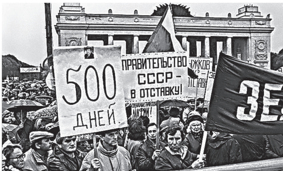
Массовые митинги в СССР в 1989–1990 годах

Все это происходило в условиях, когда государство становилось все более полицейским, когда бизнес полностью зависел от власти и, следовательно, было невозможно финансировать независимые от государства институты гражданского общества, СМИ, политические партии, профсоюзы.