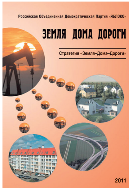
Стратегия «Земля–Дома–Дороги», 2011 год

иной форме путинской Системы и ее курса, «пути, которого нет» [14]. Надо признать, что такое представление в стране разделяли многие. Однако проблема в том, что номинальные сторонники европейского пути развития не считали своих соотечественников «достаточно европейскими» и не хотели разговаривать со страной честно и прямо, признавая ошибки и провалы, не могли дать оценку экономическим преобразованиям 1990-х. А именно это требовалось для изменения курса. Необходимо было всерьез обсуждать и формулировать позиции по ключевым проблемам и направлениям жизни страны, таким как легитимность частной собственности, преодоление олигархической системы, слияния власти с собственностью и бизнесом [15], всеобъемлющая оценка большевизма и сталинизма, осуществление настоящей экономической реформы в интересах большинства, обеспечение социальной справедливости и равенства возможностей не за счет популистских обещаний раздать деньги или «природно-ресурсную ренту», а через такие программы, как «Земля–Дома–Дороги» 28 или «Газ — в каждый дом» 29 . Однако возможности были использованы иначе.