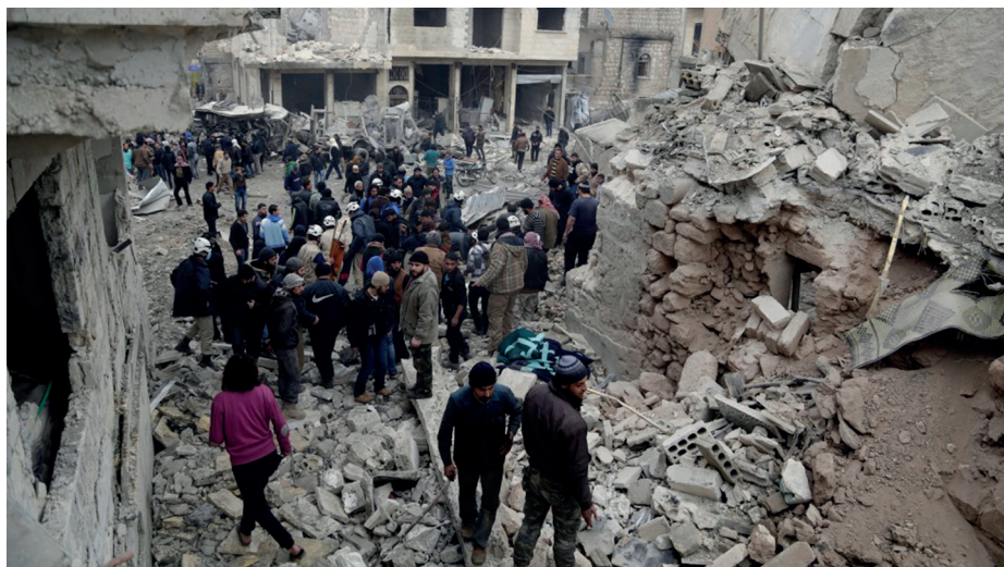
Разрушенные дома в Идлибе, Сирия. По словам местных активистов, дома пострадали в результате атак российской авиации. 12.01.2016

В 2015 году Россия ввязалась в гражданскую войну в Сирии. Российская армия отрабатывала удары с воздуха, земли и моря по сирийским городам и мирному населению. Спасая криминальный режим Асада, российское руководство еще и хвасталось испытанием на людях новых видов вооружений. Российская общественность, в том числе и считающая себя либеральной, практически никак не реагировала на действия российской армии в Сирии — эта тема не была ни предметом дискуссий в оппозиционной среде, ни пунктом в политической программе популярных оппозиционных лидеров 31 . Сегодня очевидно, что безразличие общества к участию России в сирийской войне во многом предопределило и решение Путина вторгнуться в Украину.