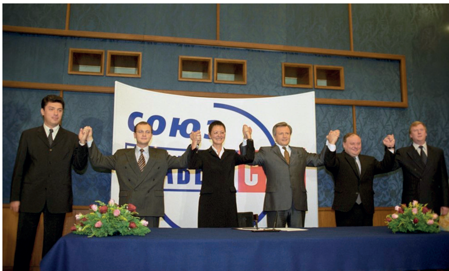
Учредительная конференция избирательного блока «Союз правых сил» в Москве. Слева направо: Борис Немцов, Сергей Кириенко, Ирина Хакамада, Константин Титов, Егор Гайдар и Анатолий Чубайс. 29.08.1999