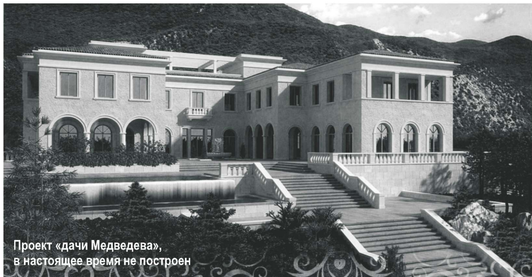
Проект «дачи Медведева», в настоящее время не построен

В ноябре 2008 года на территории заказника "Большой Утриш" в городе-курорте Анапа началось незаконное строительство автомобильной дороги к морю. Уже на тот момент ходили слухи, что дорога строится для освоения прибрежного участка на территории заказника, который облюбовало Управление делами Президента. Однако по документам участок площадью 120 гектар, к которому вела дорога, был передан в аренду загадочному фонду "Дар". В 2010 году этот участок должен был войти в состав нового Утришского заповедника, но этого так и не произошло.