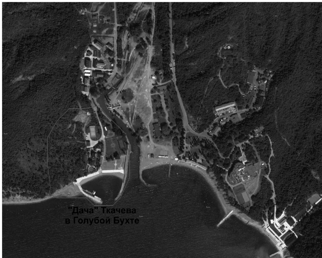
"Дача" Ткачева в Голубой Бухте

Экологов, обследовавших огороженную территорию бухты и расположенные на ней шикарные новостройки, задержала охрана, а полицейские затем доставили в ОВД. На следующий день пресс-служба губернатора Краснодарского Края Александра Ткачева сообщила, у него действительно есть земельный участок и дом "в коттеджном посёлке в населенном пункте Бжид".